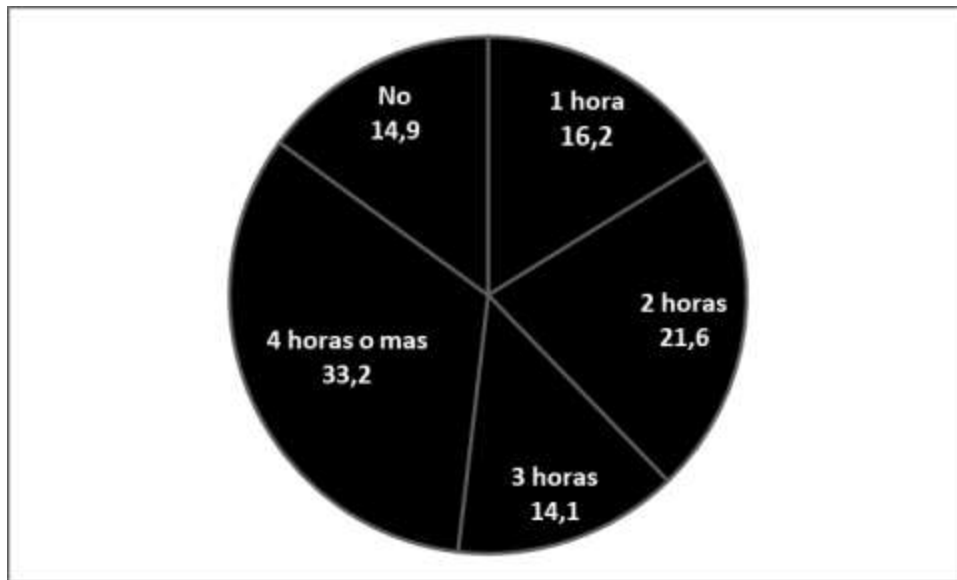
Figura 1. Horas dedicadas a actividades extraescolares semanalmente.